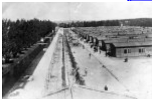
Концентрационен лагер Дахау – общ изглед към бараките, в които са живеели затворниците; оградата от бодлива тел, по която е минавал ток с високо напрежение; бараките на затворниците; април 1945 г. (IPN) Концентрационен лагер Дахау – общ изглед към бараките, в които са живеели затворниците; оградата от бодлива тел, по която е минавал ток с високо напрежение; бараките на затворниците; април 1945 г. (IPN)