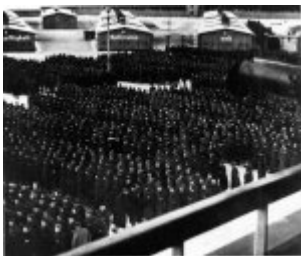
Концентрационен лагер Заксенхаузен - апел на лагерния плац, на заден план върху бараките се вижда фрагмент от надпис, вероятно със следното съдържание: "Esgibtnureinen Wegzur Freiheit, seine Meilensteine heissen: Gehorsam-Fleiss-Ehrlichkeit-Ordnung-Sauber Концентрационен лагер Заксенхаузен - апел на лагерния плац, на заден план върху бараките се вижда фрагмент от надпис, вероятно със следното съдържание: "Esgibtnureinen Wegzur Freiheit, seine Meilensteine heissen: Gehorsam-Fleiss-Ehrlichkeit-Ordnung-Sauber Nüchternheit-Wahrhaftigkeit-Opfersinn und Liebe zum Vaterland" („Има само един път към свободата и неговите крайъгълни камъни се наричат: подчинение - усърдие - честност - ред - чистота - трезвост - откровеност - жертвоготовност и любов към родината"); 1939 г.