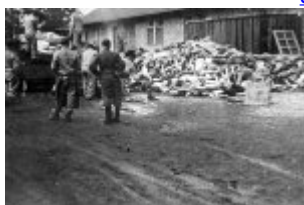
Концентрационен лагер Дахау- затворници освобождават платформата от телата на убитите; на заден план се вижда сградата на крематориума. 1945 г. (IPN) Концентрационен лагер Дахау- затворници освобождават платформата от телата на убитите; на заден план се вижда сградата на крематориума. 1945 г. (IPN)