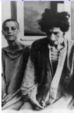
Затворнички от концентрационен лагер Равенсбрюк; 1945 г. след освобождаването на лагера (IPN) Затворнички от концентрационен лагер Равенсбрюк; 1945 г. след освобождаването на лагера (IPN)