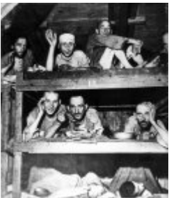
Концентрационен лагер Бухенвалд - бивши затворници на нарове в лагера; април 1945 г., след освобождаването на лагера (IPN) Концентрационен лагер Бухенвалд - бивши затворници на нарове в лагера; април 1945 г., след освобождаването на лагера (IPN)