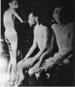
Концентрационен лагер Бухенвалд - жертви на III Райх - затворници, страдащи от хроничен глад; април 1945 г. след освобождаването на лагера (IPN) Концентрационен лагер Бухенвалд - жертви на III Райх - затворници, страдащи от хроничен глад; април 1945 г. след освобождаването на лагера (IPN)