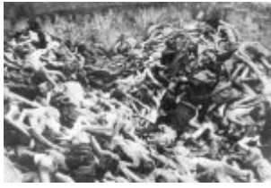
Концентрационен лагер Берген-Белзен - общ гроб на убити затворници; април 1945 г. след освобождаването на лагера (IPN) Концентрационен лагер Берген-Белзен - общ гроб на убити затворници; април 1945 г. след освобождаването на лагера (IPN)