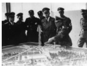
Германски офицери на посещение в концентрационния лагер Дахау; на преден план, при макета на лагера, е щандартенфюрерът от СС д-р Вилхелм Пфаненщийл; януари 1941 г. (IPN) Германски офицери на посещение в концентрационния лагер Дахау; на преден план, при макета на лагера, е щандартенфюрерът от СС д-р Вилхелм Пфаненщийл; януари 1941 г. (IPN)