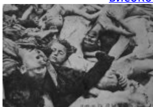
Концентрационен лагер Дахау - трупове на убити затворници; април 1945 г. след освобождаването на лагера Концентрационен лагер Дахау - трупове на убити затворници; април 1945 г. след освобождаването на лагера